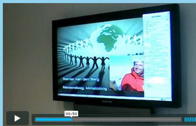
Impressie van een webinar.

Na afloop werden de meningen gepeild via een onderzoeksbureau. Het webinar kreeg van de meeste deelnemers een acht of hoger. De presentatie en beantwoording van vragen scoorden goed, evenals de bruikbaarheid en toepasbaarheid in het werk. Als grootste voordeel werd minder reizen genoemd. Meer dan de helft van de deelnemers bespaarden twee of meer uur reistijd. Ook 'makkelijk meedoen' werd vaak genoemd. Nadelen waren er ook. Zo vond een aantal deelnemers het webinar wat afstandelijk. "Maar over het algemeen is het webinar een goed interactief middel voor kennisoverdracht. Daarnaast is het milieuvriendelijk en kostenbesparend", zegt Bakker. "We gaan dan ook zeker verder met webinars."