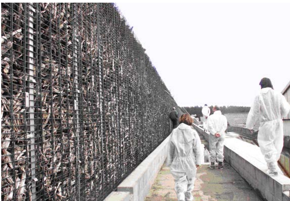
Biofilter van wortelhout.

Op 20 en 21 juli 2011 organiseerde de universiteit van Bonn een workshop over emissievermindering uit de veehouderij. De bijeenkomst was gericht op deskundigen van overheden en kennisinstituten. InfoMil Perspectief zet de meest opvallende punten op een rij.