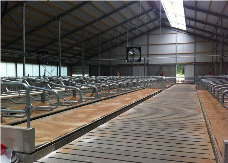
Foto van een ligboxenstal met de roostervloer met afdichtkleppen