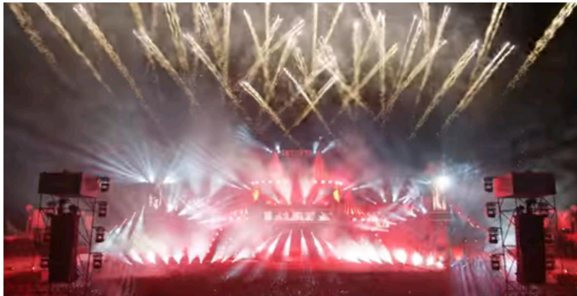
Landelijke vuurwerkdag 2 oktober 2018