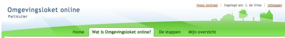
Afbeelding 2 Particulier wel ingelogd