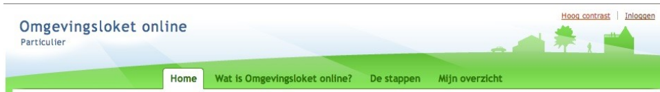
Afbeelding 1 Particulier niet ingelogd (zakelijk toont de snelkoppeling identiek)

Onderstaande afbeeldingen tonen de hoog contrast snelkoppeling zoals die er uit ziet op de verschillende pagina's als de particulier of zakelijke bezoeker niet en wel is ingelogd.