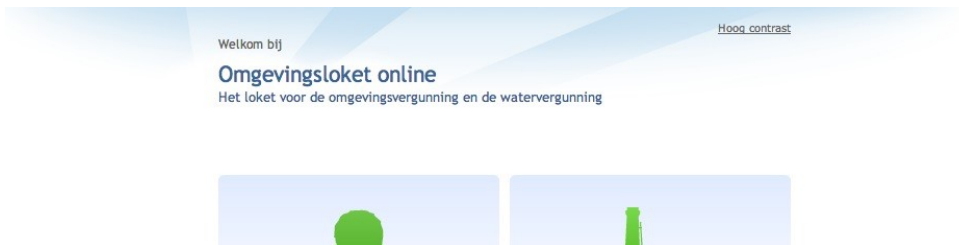
Afbeelding 4 Portaalpagina

Alshoog contrast niet aan staat en de browser ondersteunt Javascript en Javascript is ingeschakeld dan zal het aanklikken van deze snelkoppeling de hoog contrast modus direct aanzetten.