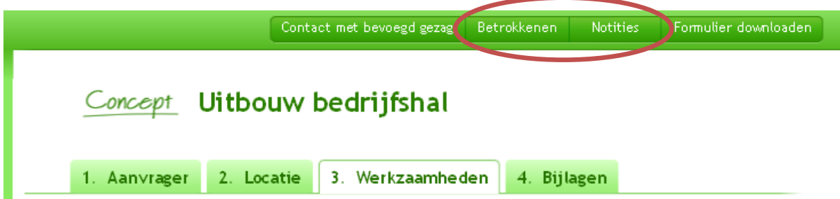
Afbeelding 5: scherm

Indien aan een concept aanvraag 'Betrokkenen' of 'Notities' toegevoegd worden, blijven die na het splitsen van de aanvragen en meldingen aan alle aanvragen en meldingen gekoppeld.