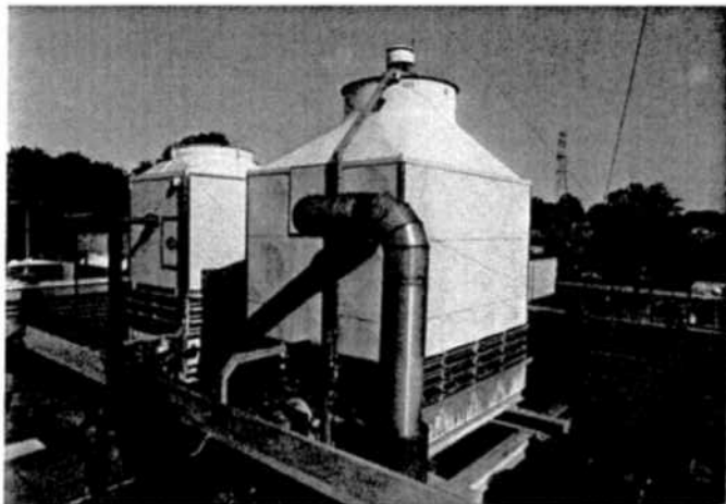
Natte koeltorens bij Kiwa Gastec

Naar aanleiding van het verzoek van het ministerie is in 2008 door de afdeling Milieu het project 'Inventarisatie natte koeltorens binnen de gemeente Apeldoorn' opgezet. Het doel van het project is alle natte koeltorens binnen de gemeente Apeldoorn in kaart te brengen en deze digitaal in onze viewer (geografisch informatiesysteem) beschikbaar te maken. Daarnaast moet het toezicht op beheer en onderhoud geborgd worden in de werkprocessen binnen de afdeling Milieu.