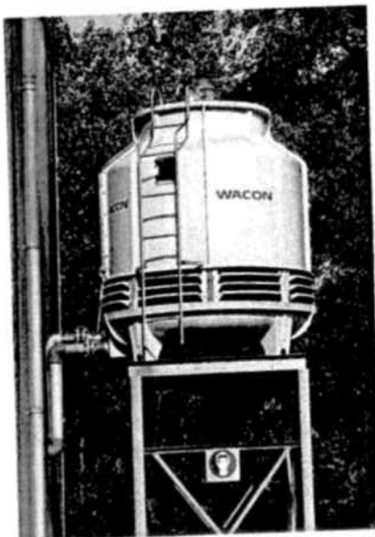
Natte koeltoren bij Holland Colours