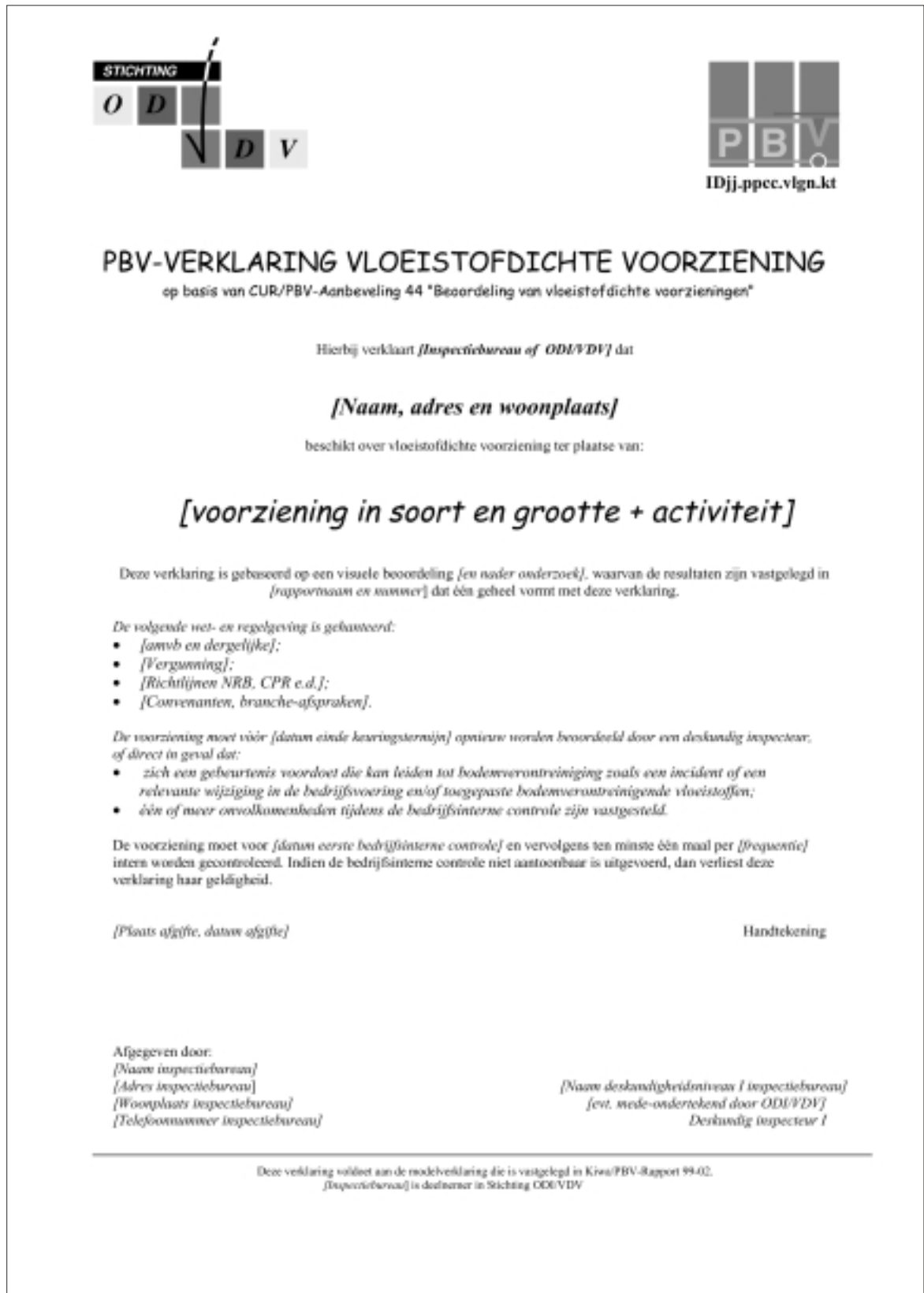
Figuur Voorbeeld PBV-verklaring vloeistofdichte voorziening